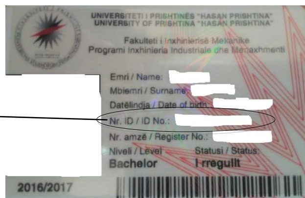
Fig. 1. Qasja në aplikacion.

Në fushën PËRDORUESI duhet të shënohet numri i ID kartelës së studentit përkatës. Ndërsa tek fusha FJALËKALIMI shënohet fjalëkalimi i studentit i cili për herë të parë është: Numri personal i studentit . Pasi të qaseni ju duhet ta ndryshoni fjalëkalimin tuaj si në figurën me poshte dhe të klikoni butonin Dërgo Fig.2